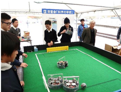
サッカーロボット実演