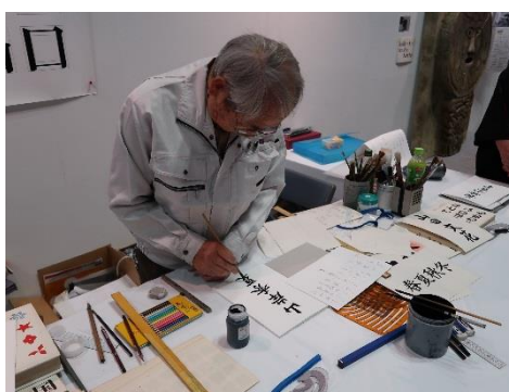
きれいな文字の書き方実演指導