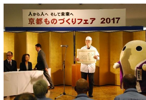
京都府菓子技能士会