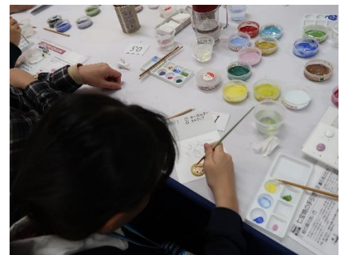
七宝焼技能の実演・体験