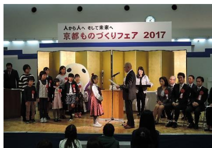
瓦のある風景絵画展表彰式