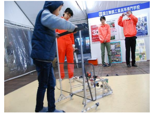
ロボット操作を体験しよう！