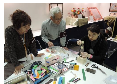
キーホルダー作り