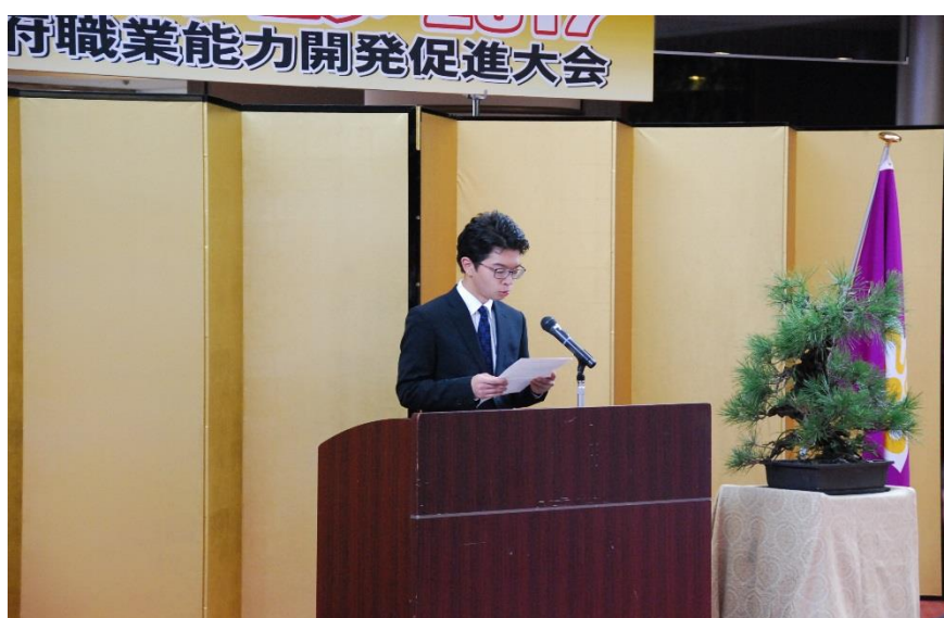
訓練生作文コンクール最優秀賞朗読

「京都ものづくりフェア2017」にご出展いただきました団体・企業の皆様をはじめ、ご協賛、ご後援いただきました関係機関、金融機関様に対しまして、厚く御礼を申し上げます。