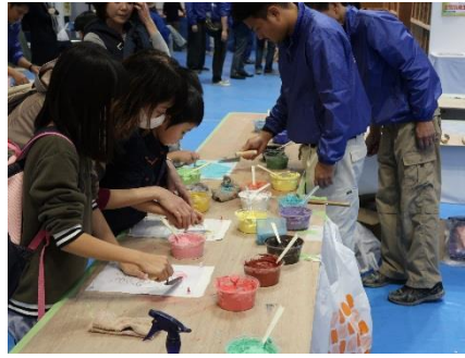
聚楽土塗り絵体験