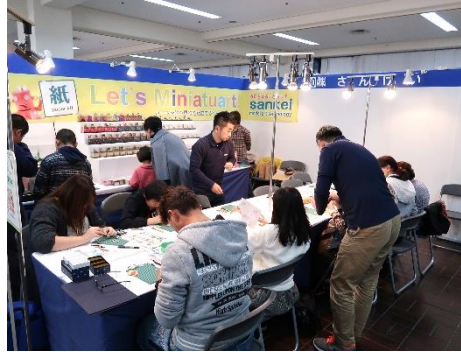
ミニチュアの製作体験