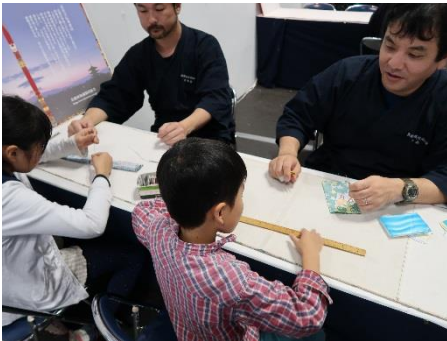
ティッシュケース作り