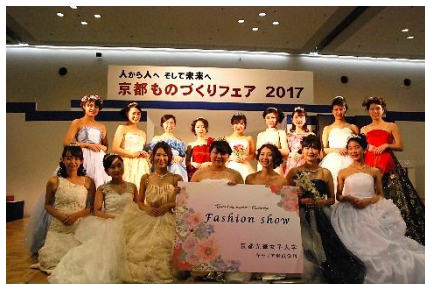
ファッションショー (京都光華女子大学)