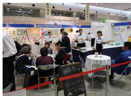
訓練生による喫茶サービス