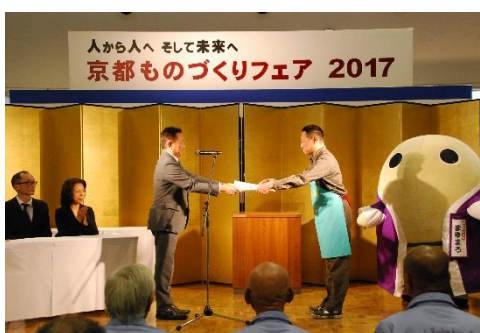
テントシート技能士会・組合