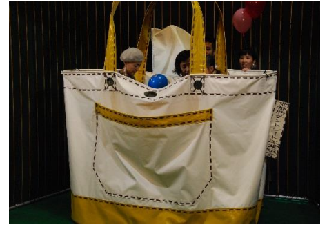
デカ鞆に入って記念撮影