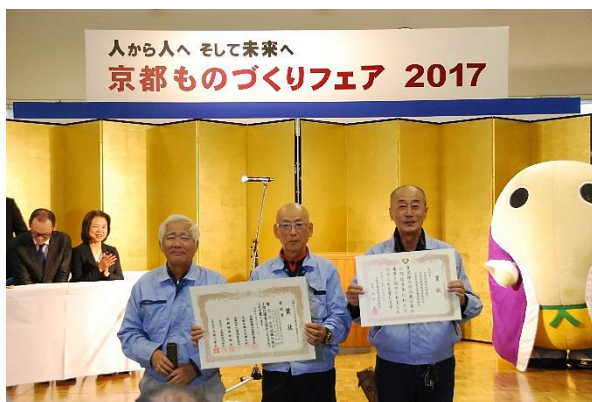
板金訓練校・組合・技能士会