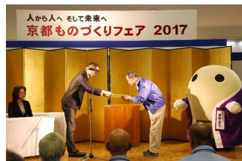
左官組合連合会・技能士会・組合・訓練校