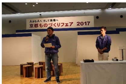
段ボールの豆知識&ゲーム