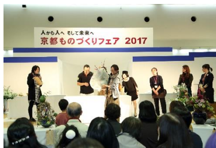
フラワーパフォーマンス