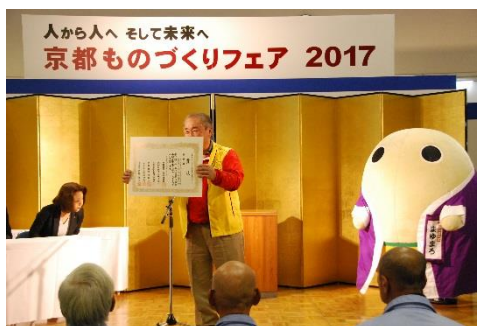
電気技術訓練校・電気工事協同組合