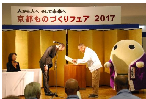
タイル技能士会・組合