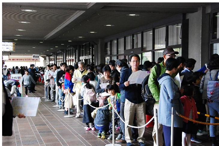
入場を待つご来場者