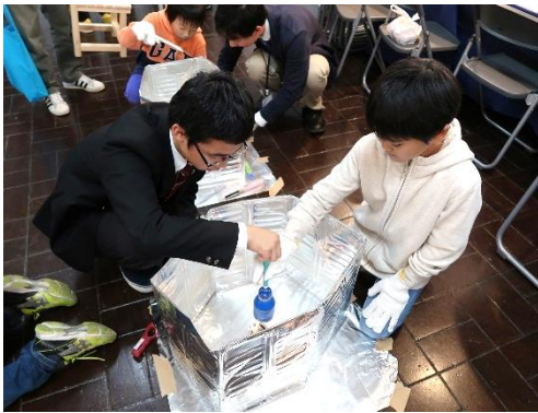
スクロールナノファイバーって何？ ～手作りわた菓子体験～