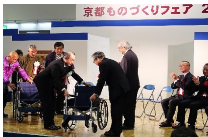
全技連マイスターの紹介イベント