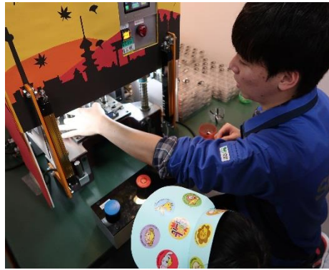
薄板で昆虫づくり