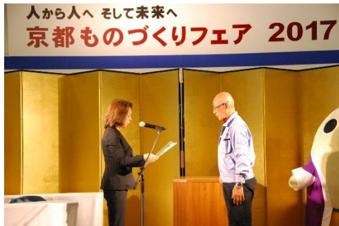
板金訓練校・組合・技能士会