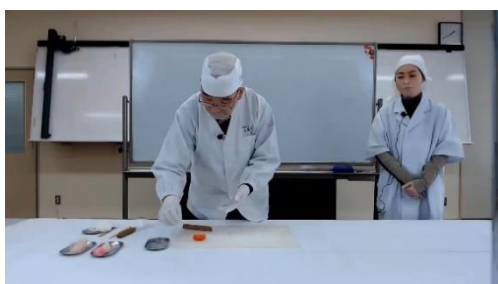
Zoom によるものづくり体験 和菓子