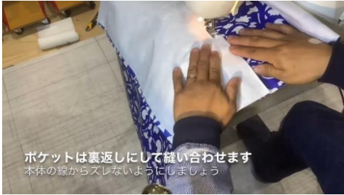
動画配信によるものづくり体験 「トートバッグ（テントシート）」