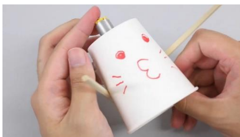
Youtube ライブによるものづくり体験 「ぷるぷるロボット（京都職業能力開発促進センター）」