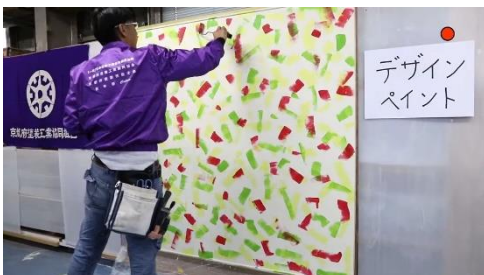
Youtube ライブによるパフォーマンス 「デザインペイント（塗装）」 「アクリルエマルジョン（塗装）」 「しっくいペイント（塗装）」