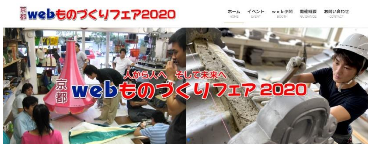
専用サイトトップページ