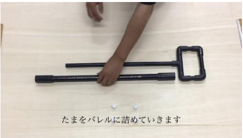
動画配信によるものづくり体験 「空気てっぽう（管工事）」