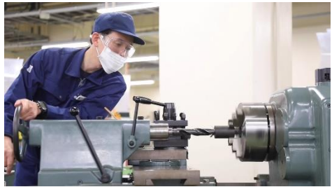
Youtube ライブによるパフォーマンス 「ものができるまで（旋盤）」