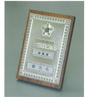
⑩2級机上用 24cm × 16.5cm × 2cm ¥13.000