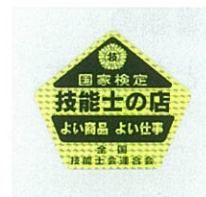
⑳シール(2枚1組) (縦・横14cm) ¥1.000