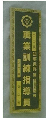
⑮指導員門標 (37cm × 12cm × 1cm) ¥14.000