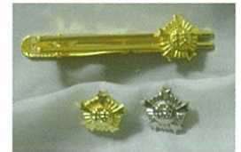
⑰ネクタイピン ¥1.300 ⑱バッチ1級金・2級銀 (直径1.2cm) ¥1.200