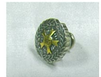
⑯全技連バッチ (直径1.4cm) ¥1.600