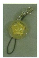
㉑技能士 ストラップ キーホルダー (直径1.8cm) ¥1.400