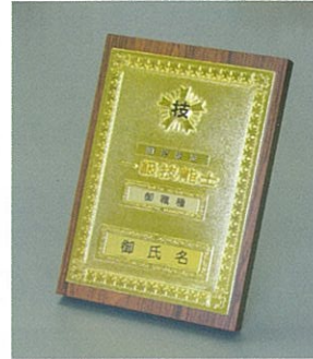
⑥1級机上用 (ダ イラスト製1級金メッキ・2級銀メッキ) ¥14.500